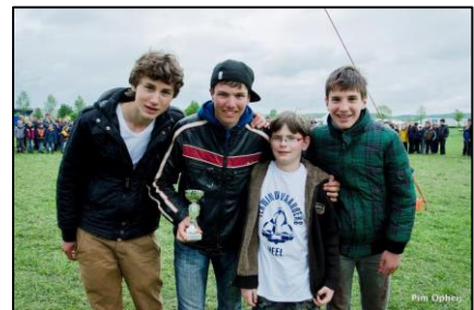
Figuur 2, prijswinnaars zwijntjesrace