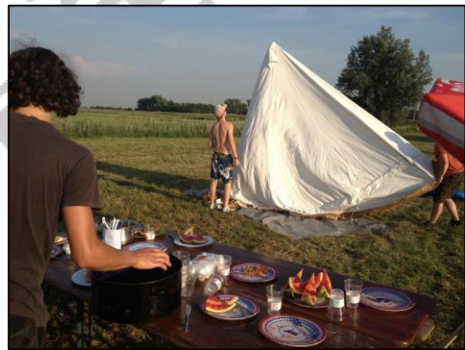
Figuur 3, samen koken en tent opbouwen

Ter voorbereiding op NaWaKa heeft de WVA heitje voor karweitje uitgevoerd. De kosten van een dergelijk zomerkamp zijn in vergelijking met een regulier kamp namelijk fors (meer dan 2x zoveel). Eind 2013 is de WVA dan ook gestart met het uitvoeren van enkele klusjes (zoals beplanting rooien, stukje bestrating leggen, helpen met verhuizen, etc.).