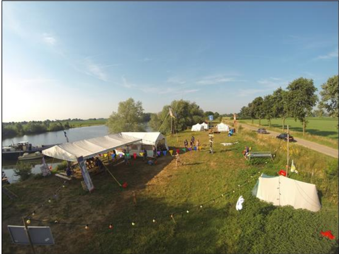
Figuur 1, impressie van het zomerkamp terrein in Heijen