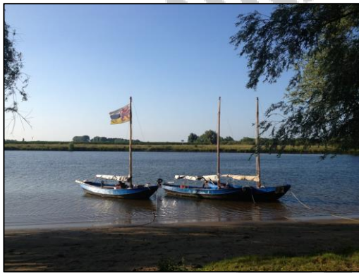
Figuur 4, de vloot tijdens zomerkamp

Dit jaar met zomerkamp heeft de Wilde Vaart een 10 daagse trektocht gemaakt vanuit Lith, via de Biesbosch met als keerpunt Hellevoetsluis. Vanuit het vertrouwde vaarwater van de Maas zijn ze richting het grote open water gevaren en hebben daarbij zelfs een stukje zout water meegepikt. Al met al een zeer uitdagende route.